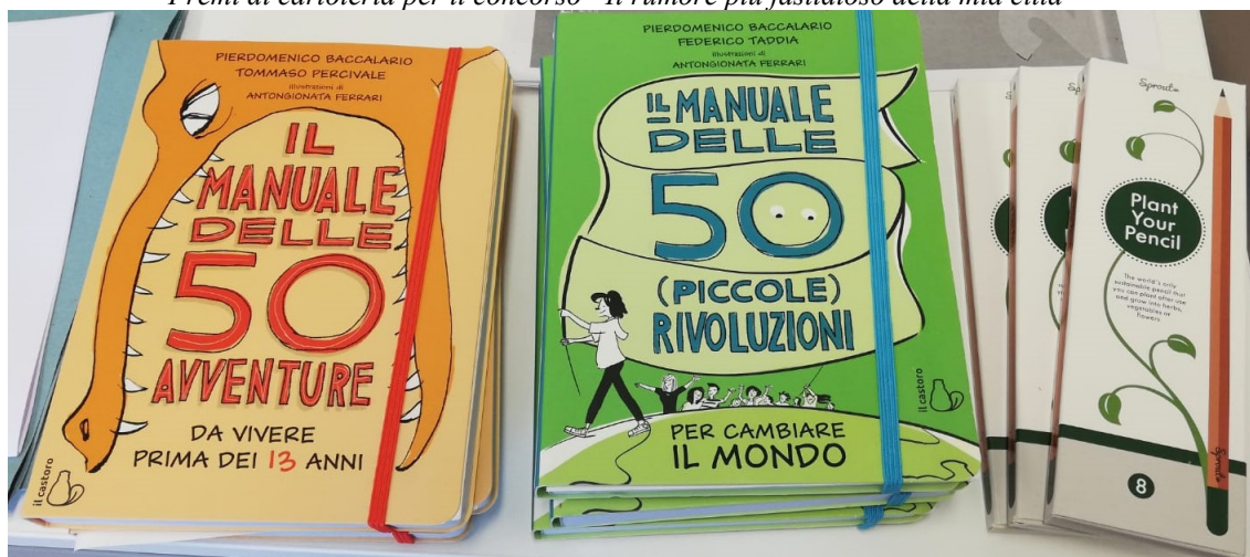
Premi di cartoleria per il concorso "Il rumore più fastidioso della mia città"

I disegni sono stati giudicati in base all'originalità, alla coerenza con il tema del concorso e alla tecnica grafica di realizzazione.