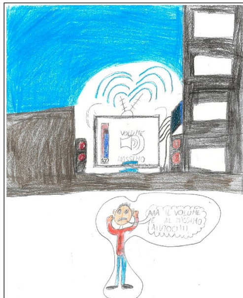
Vincitori del concorso "Il rumore più fastidioso della mia città" della classe 3ªB- Scuola Gianni Rodari