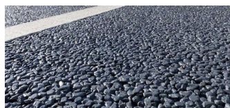
NUOVA PAVIMENTAZIONE A BASSA RUMOROSITÀ