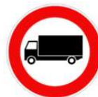
LIMITAZIONE DEI MEZZI PESANTI