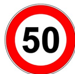
LIMITAZIONE DELLA VELOCITÀ